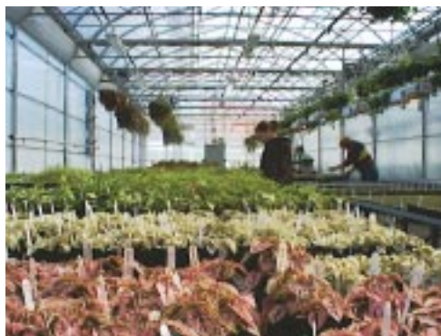
LES PRODUCTIONS PRINTANIÈRES DANS UNE DES SERRES DU CENTRE DE FORMATION HORTICOLE DE LAVAL.

Si, comme nous venons de le constater, l'activité horticole lavalloise comprend un réseau institutionnel important qui se consacre à l'innovation, à la formation et à la promotion, la recherche et le développement font également partie intégrante de la filière horticole de Laval. Ainsi l'INRS-Institut Armand Frappier avec son laboratoire de physiologie végétale, le Centre de services horticoles de Laval mis sur pied par le ministère de l'Agriculture, des Pêcheries et de l'Alimentation du Québec et l'École hôtelière de Laval de la Commission scolaire de Laval sont autant de ressources qui servent les agriculteurs lavallois et contribuent à l'expansion de l'horticulture et de l'agriculture dans l'Agroparc.